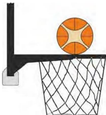
Dijagram 3 Lopta u kontaktu s obručem

31-19 Tvrđnja: Prekršaj pravila nedozvoljene igre na loptu je načinio igrač obrane ili napada tijekom šuta na koš iz igre kada igrač dotakne koš (obruč ili mrežicu) ili tablu dok je lopta u kontaktu s obručem i još uvijek može ući u koš.