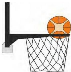
Dijagram 4 Lopta je unutar koša

31-24 Tvrdnja: Prekršaj pravila nedozvoljene igre na loptu je ako obrambeni igrač dotakne loptu kada je lopta unutar koša.