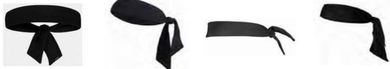
Dijagram 1 Primjeri traka u obliku šala

4-4 Tvrđnja: Nošenje traka u obliku šala nije dopušteno.